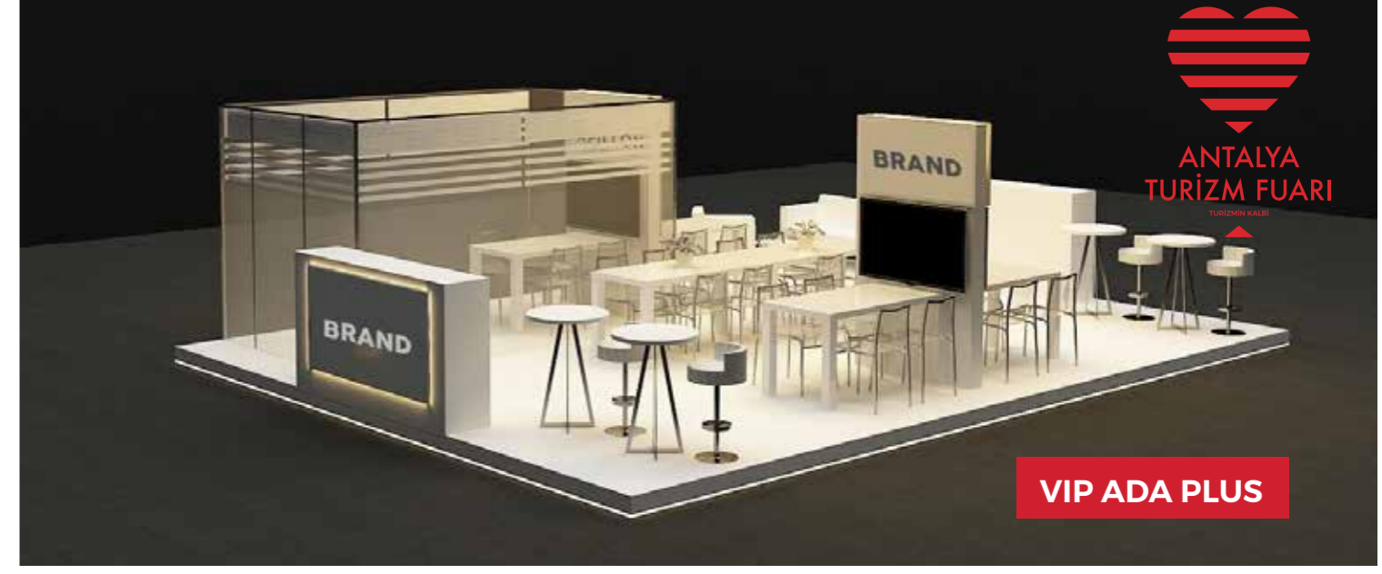
VIP ADA PLUS